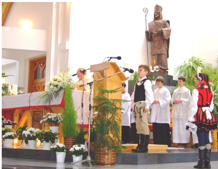
2011. május 8. Csíkszereda - Szent Ágoston plébánia 102 gyermek járult elsőáldozáshoz

Ezt a levelet II. János Pál pápa nagyon személyes hangon írta, és kifejezetten a gyermekeknek szánja. A levélben felidézi Jézus gyermekkorát, majd pedig azokat a jeleneteket, amik azt mutatják, hogy Jézus felnőtt korában is mennyire kedvelte a gyermekeket.